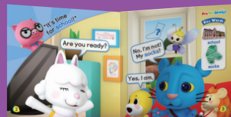
Animation Story Book